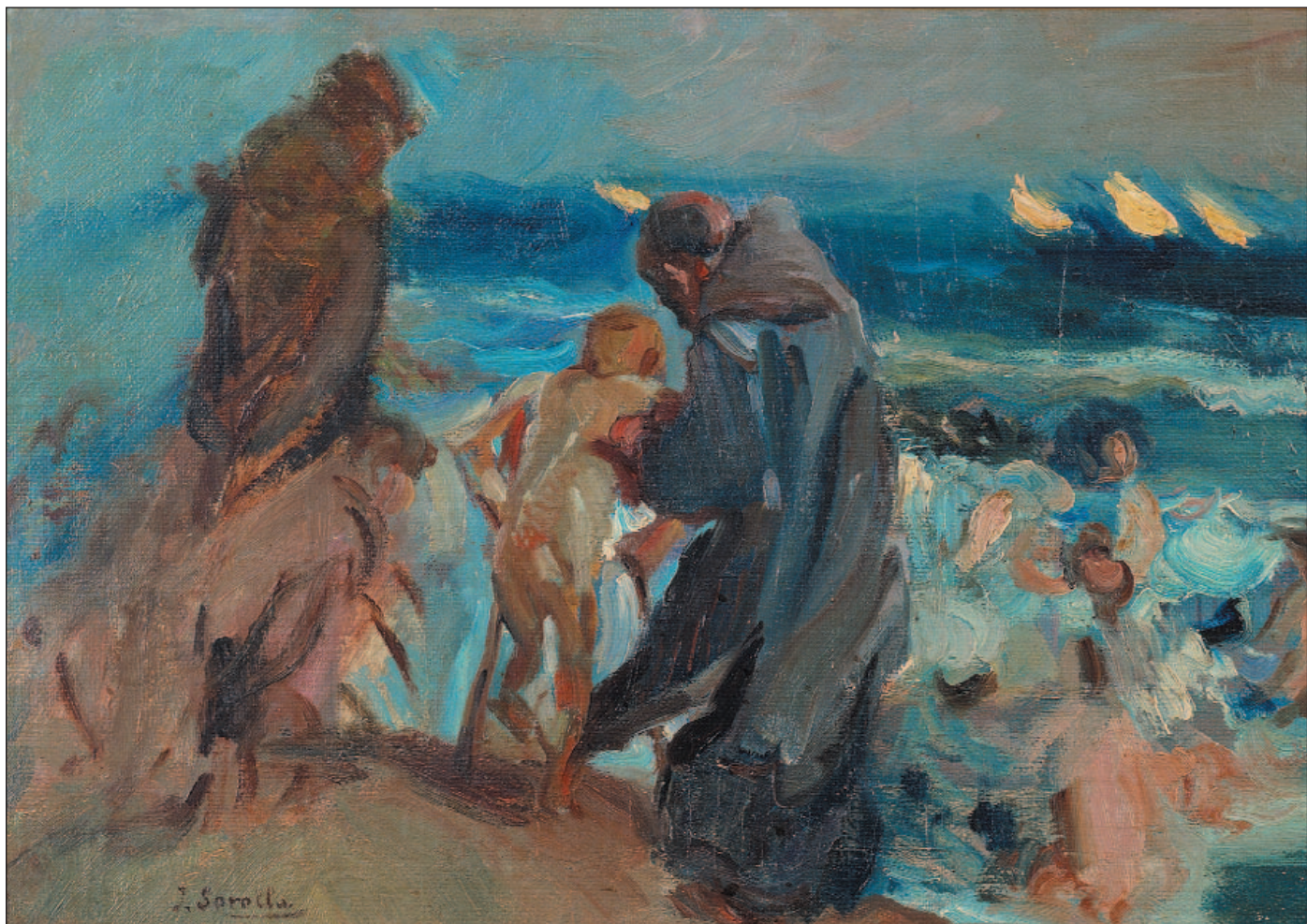
Boceto de triste herencia, de Joaquín Sorolla, un óleo sobre tela, que pertenece a la colección artística Bancaixa, de Valencia.

Ribera, o "Retrato de un Eclesiástico", que pintara Vicente López, en 1814, y que llega desde EEUU cedido a esta exposición.