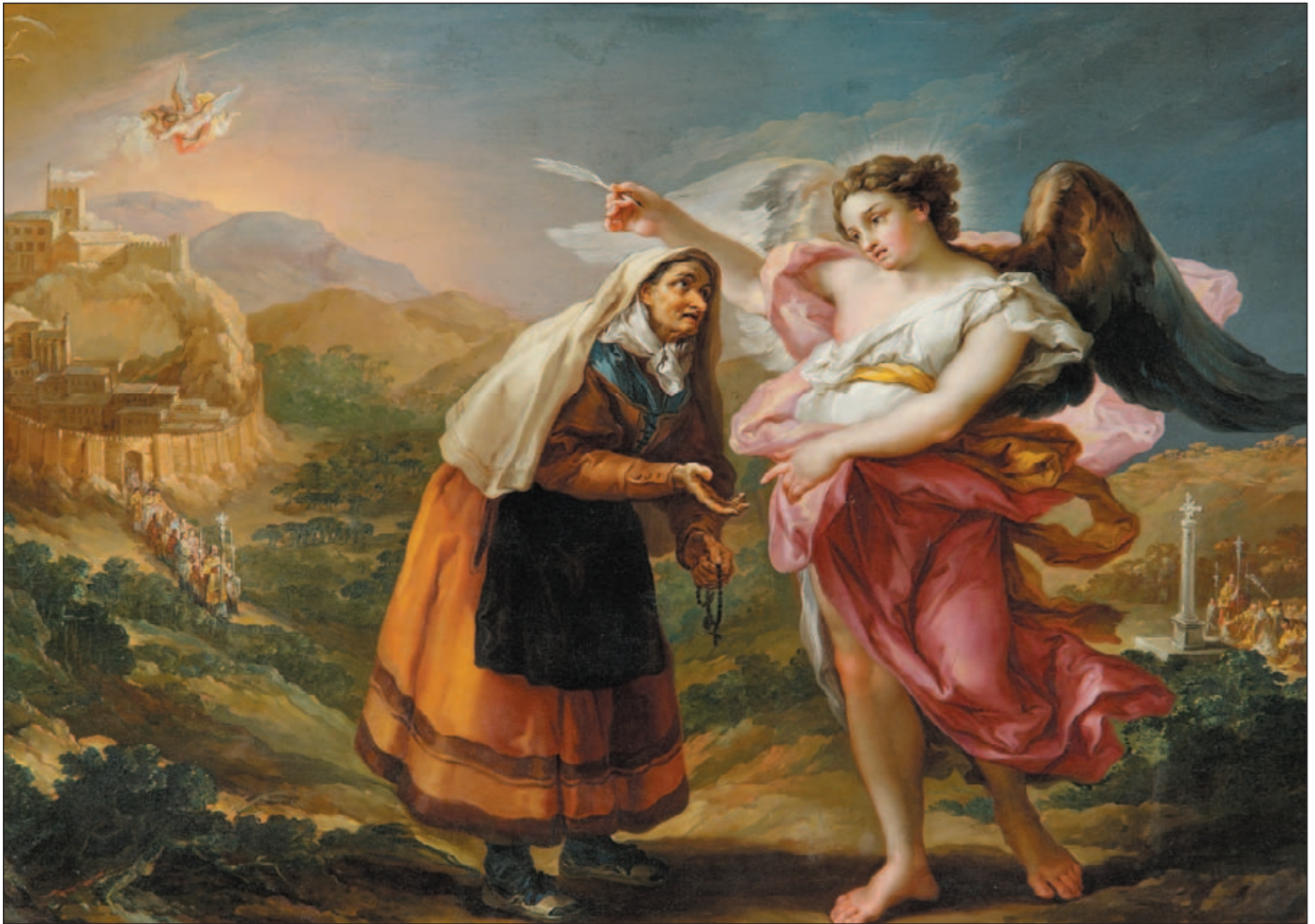
Ángel Tutelar de la Villa de Ayora, de Vicente López, un magnífico óleo sobre lienzo de 1803, de la iglesia de Ayora (Valencia).

Más de 300 obras del Cristianismo se exhiben en la ciudad valenciana, patria chica de los papas Calixto III y Alejandro VI