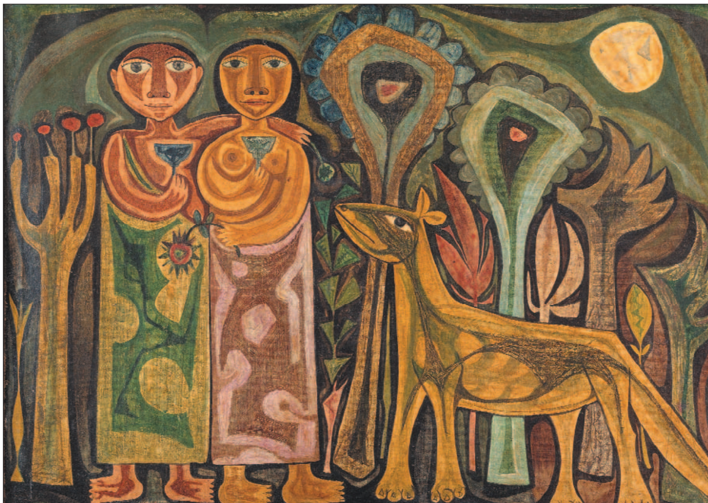
El Paraíso, una obra de Manolo Gil (1995) de la Fundación Bancaixa, que se exhibe en Xàtiva, dentro de las últimas tendencias.

costado 15 millones de euros, lo que supone la mayor inversión que se realiza a través de la Generalitat en una ciudad con motivo de una exposición de La Llum de les Imatges.