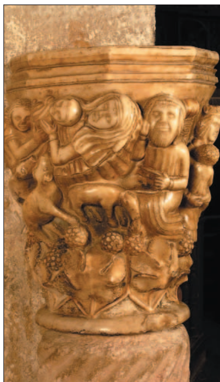
Pila de agua Bendita (s.XIII). S.Feliú (Xàtiva).