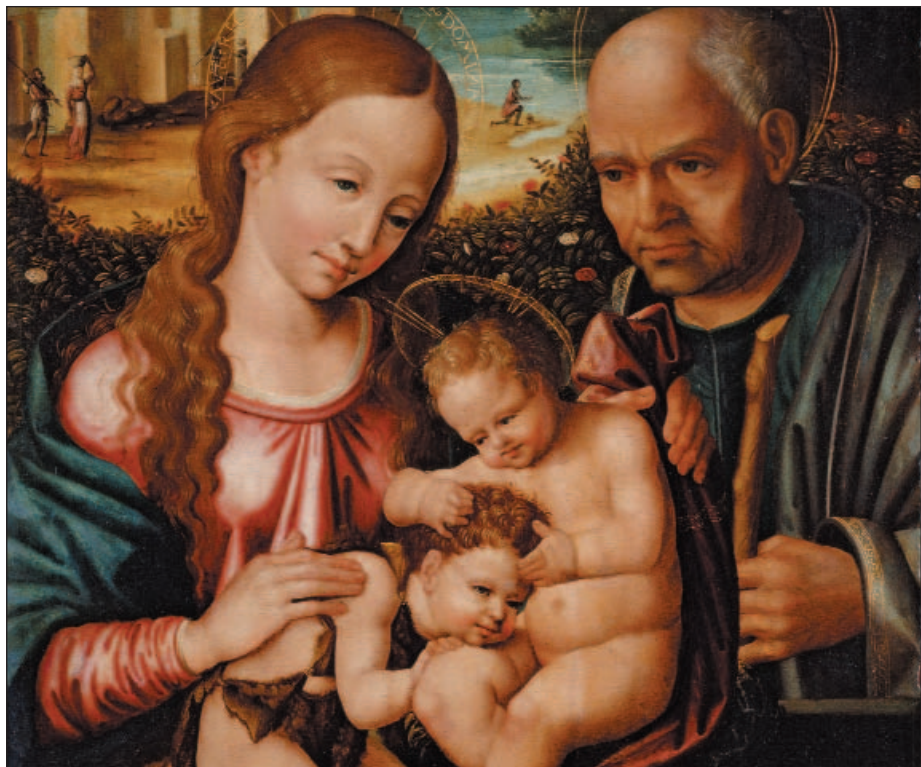
Sagrada Familia con San Juanito, de Paolo da San Leocadio, un óleo sobre tabla (1.515).

Hay piezas concedidas por museos y colecciones privadas de toda España, de Ávila, Valladolid, Tarragona, Barcelona, Vizcaya o Sevilla, que prestan legados de artistas de la talla de Paolo San Leocadio, Vicente Macip o Joan Reixach. Junto a ellas, obras del s. XX, de Joaquín Sorolla y Mariano Benlliure. Y otras como la "Piedad de la Virgen" de Jorge Oteiza, o el "Ecce Homo" de George Roualt. Se exponen documentos, libros, fotografías y obras de Starnina, Pere Nicolau, Gonçal Peris, Jacomart, Bartolomé Bermejo, los Osona, Paolo da San Leocadio, Yáñez de la Almedina, Vicent Macip, Joan de Joanes, Ribalta, Ribera y Vergara. Y también de Boix y Rafael Armengol. Además se reúnen por primera vez pergaminos con la "Bula de Benedicto XIII erigiendo en colegiata la iglesia de Santa María de Xàtiva" el "Sermonario de Sant Vicent Ferrer"; la "Carta autógrafa de San Juan de Ribera" y el "Breve de Pablo VI autorizando al Abad de la Colegiata de Xàtiva el uso de mitra y báculo".